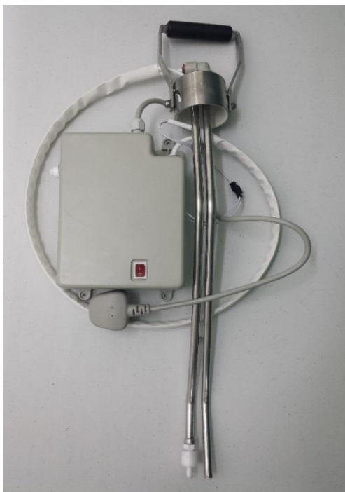
↑ Model : XY-1